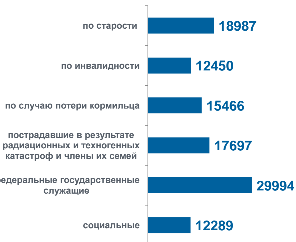
Средний размер назначенных пенсий в % к соответствующему периоду предыдущего года