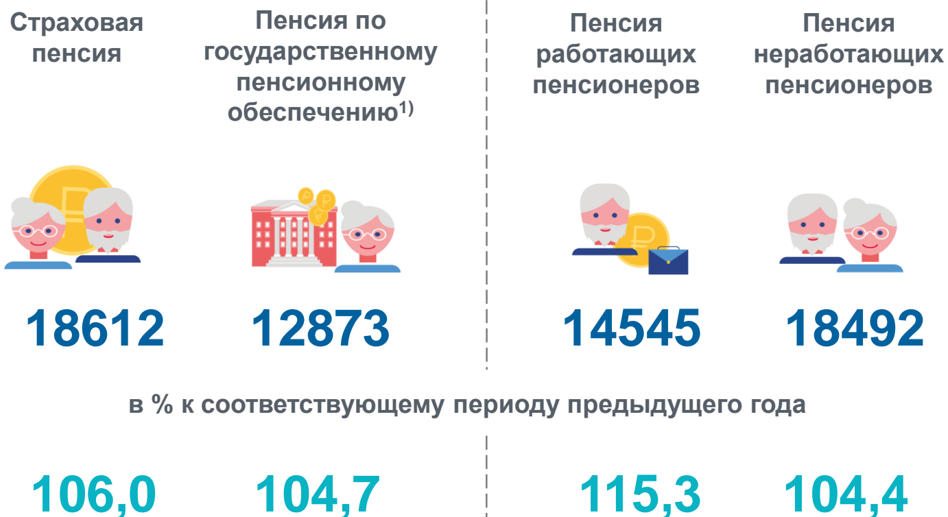
Средний размер назначенных пенсий